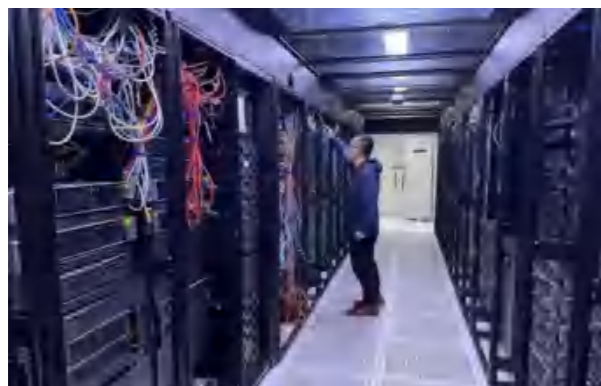
上海证券信息技术部工程师检查机房设备

“3月27日晚上9点钟，一看到浦东要开始新一轮核酸筛查的通知，我们立即按计划安排同事连夜调往浦东备用机房，一定要保障系统安全正常运转。”上海证券主机房位于浦西，另有一个同城备用机房位于浦东。从3月16日起，信息技术总部已经启动应急预案，安排工作人员AB岗、24小时在公司驻守，每周轮休。