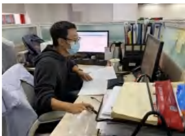
上海证券运营中心工作人员在公司值班

在疫情面前，既要保障经营管理工作的正常运行，又要保护自身安全，还要投入到防控疫情的“攻坚保卫战”中，每一位上证人都积极行动，在各自的岗位上作出了非凡贡献。