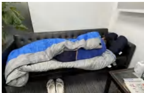
上海证券工程师把公司沙发作为简易床铺休息

此外，在无法到柜台办理业务的情况下，大量客户服务转至客服中心线上承接。上海证券数